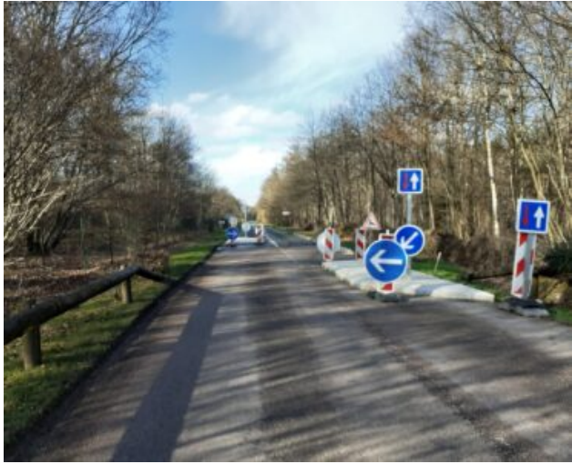
Chicane route des Andelys