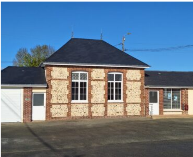
Salle du Tilleul