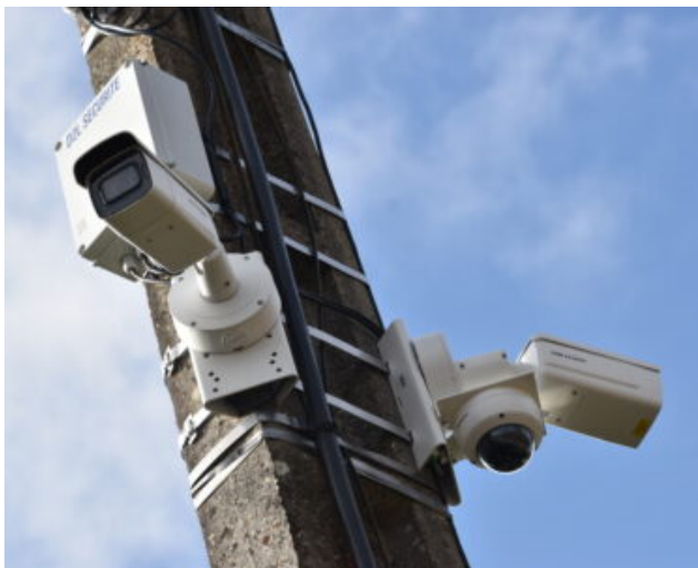
Vidéo protection du village